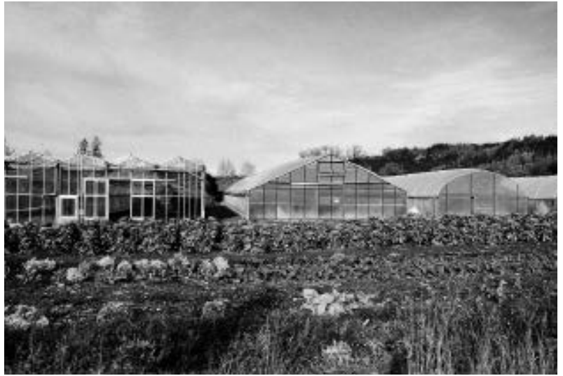
Die Gewächshäuser in Herzogsägmühle.

Nach Kriegsende übernahm der Verein für Innere Mission in München e.V. den Betrieb in Herzogsägmühle. Unter dem Motto „Herzogsägmühle – Antwort auf Nöte der Zeit“ fand der Ort zu neuen Aufgaben und